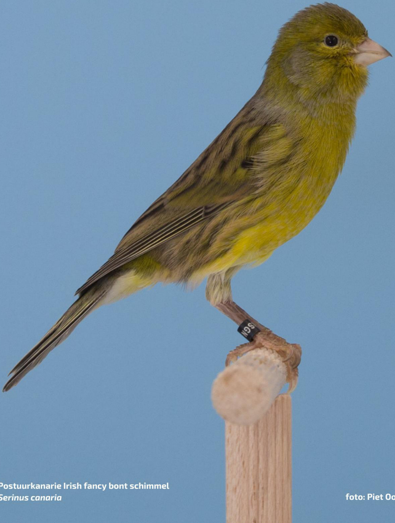
Postuurkanarie Irish fancy bont schimmel Serinus canaria