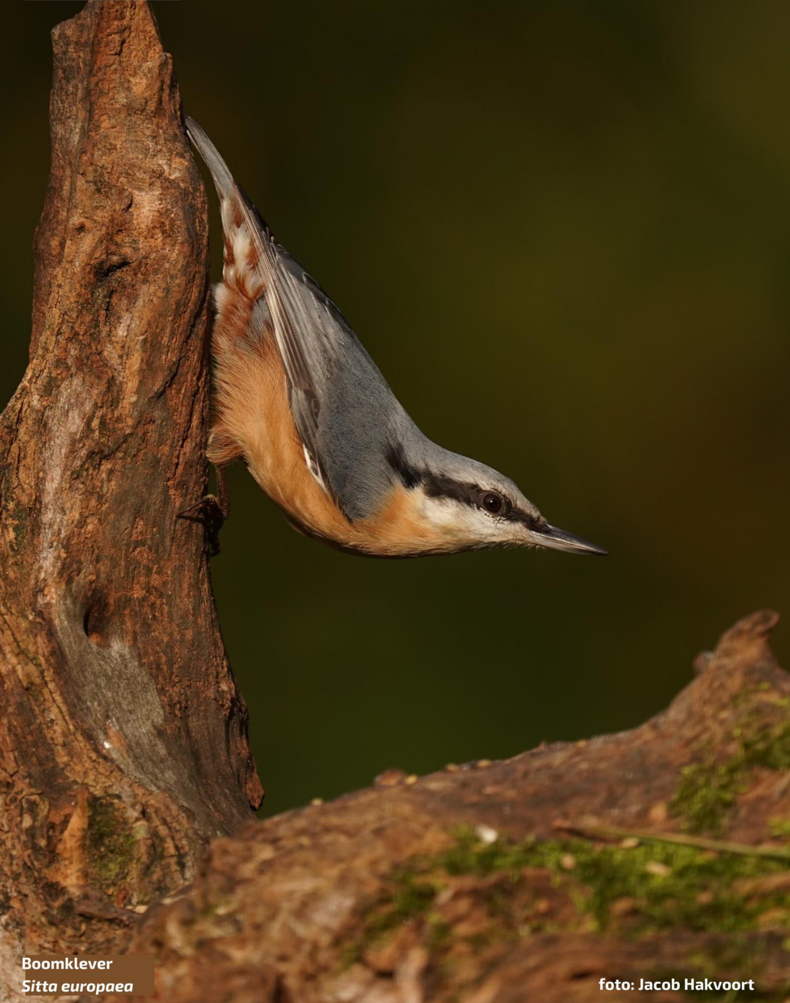
Boomklever Sitta europaea